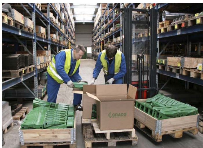
Auf dem Weg zum Kunden: maXforce-Zähne werden bei Craco für den Versand kommissioniert.